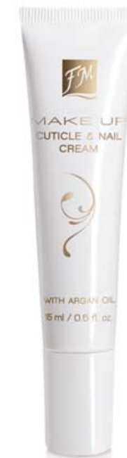
FM | KR4 CUTICLE & NAIL CREAM