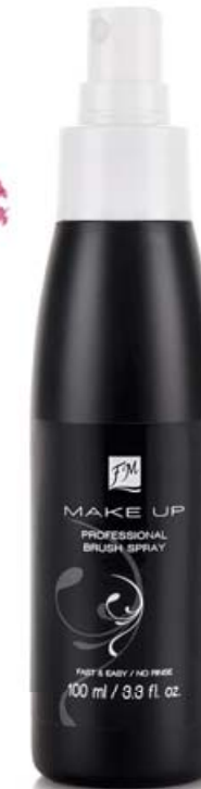
FM | W010 PROFESSIONAL BRUSH SPRAY