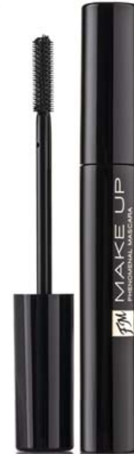
FM | M006 INTENSE BLACK

ELASTYCZNA MINISZCZOTECZKA PERFEKCYJNIE PODKRĘŚLA NAWET NAJKRÓTSZE I NAJDELIKATNIEJSZE RZĘSY.