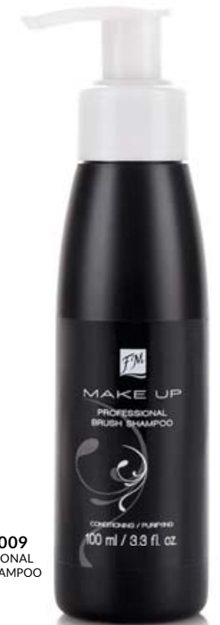
FM | W009 PROFESSIONAL BRUSH SHAMPOO