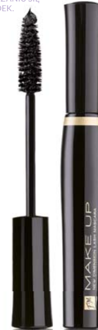
FM | NM01 HYPNOTIC BLACK

KLASYCZNA SZCZOTECZKA ŚWIETNIE ROZDZIELA RZĘSY I ZAPOBIEGA OSADZANIU SIĘ GRUDEK.