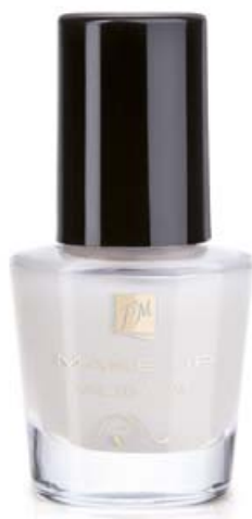
FM | N036 NAIL TOP COAT MATTE EFFECT