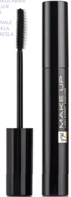
FM | M007 GLAM BLACK