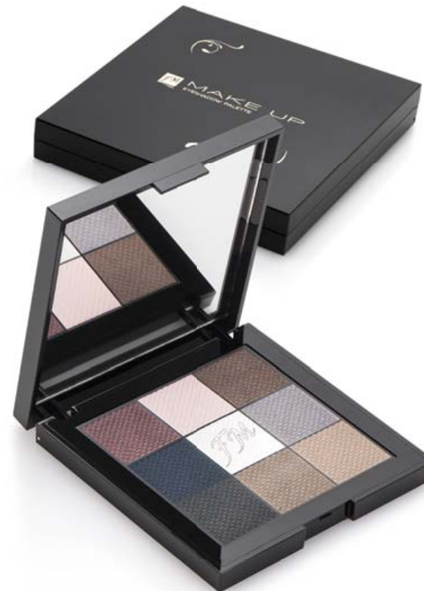
606001 EYESHADOW PALETTE

1 PALETA, 9 KOLORÓW, TYSIĄCE STYLIZACJI.