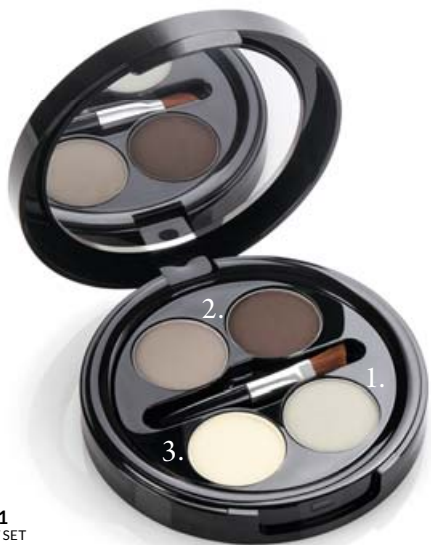
FM | ZB1 EYEBROW SET

CIENIEM ROZŚWIETLAJĄCYM PODKREŚL ŁUK BRWIOWY.