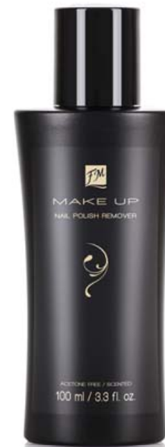
603001 NAIL POLISH REMOVER

NAWILŻA PAZNOKCIE, A SKÓRKOM NADAJE MIĘKKOŚĆ I DELIKATNOŚĆ.