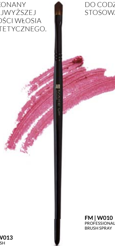
FM | W013 LIP BRUSH

WYKONANY Z NAJWYŻSZEJ JAKOŚCI WŁOSIA SYNTEZYCZNEGO.