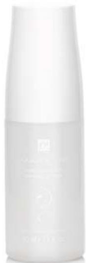
FM | N100 NAIL LACQUER DRYING SPRAY