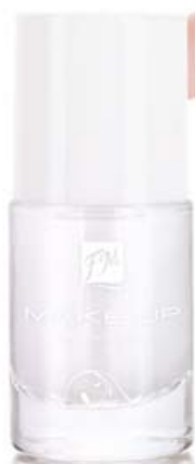
FM | N104 NAIL HARDENER