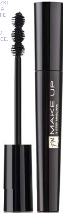
FM | M002 PERFECT BLACK

INNOWACYJNY KSZTAŁT SZCZOTECZKI UMOŻLIWIA NANIESIENIE TUSZU OD NASADY RZĘS AŻ PO SAME KOŃCE.