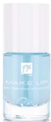
FM | N109 NAIL CONDITIONER WITH KERATIN