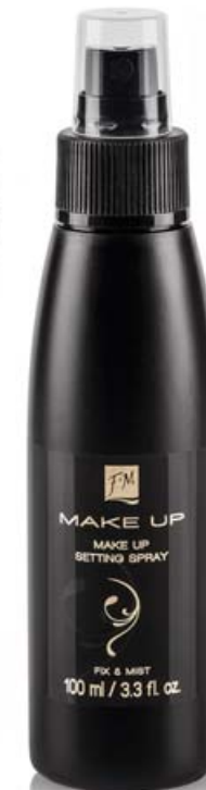
FM | UM1 MAKE UP SETTING SPRAY