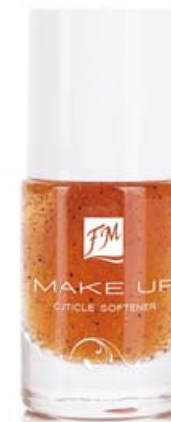
FM | N108 CUTICLE SOFTENER

WYCIĄG Z ALG zmiękcza skórki, ułatwiając ich skuteczne usunięcie.